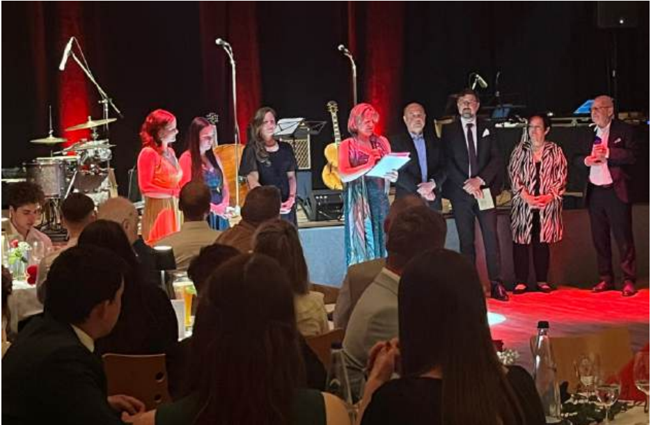
Die drei nominierten Sportlerinnen bei der Vorstellung und anschließender Ehrung