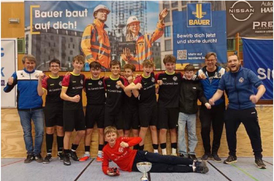
Sieger des U15 Bauer AG-Cups: Die SG BC Aichach/WF Klingen/SG Mauerbach