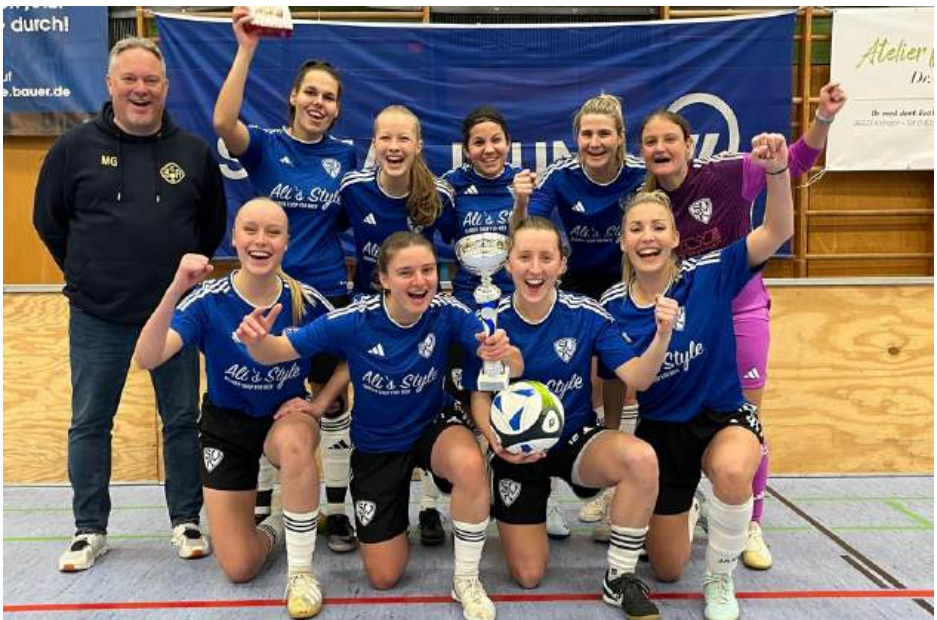
Sieger des 2. Signal Iduna-Weihnachts cups der Damen: SpVgg Kaufbeuren