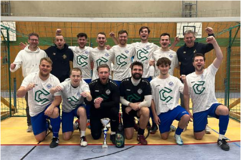
Sieger des DB Performance Neujahrscups: Team BC Aichach!!!