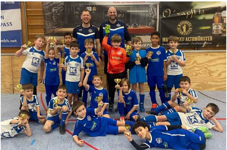
Unsere F2-Jugend beim U8 Küchenstudio Carola Graul-Cup