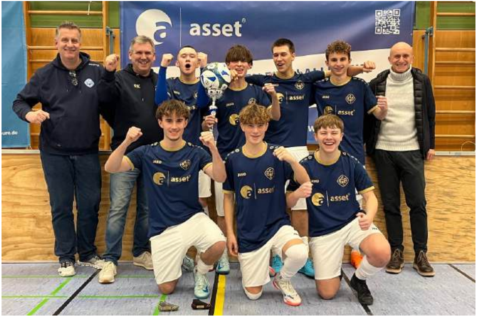
Sieger des U19 asset bauen wohnen-Cups: Die A-Jugend des BCA