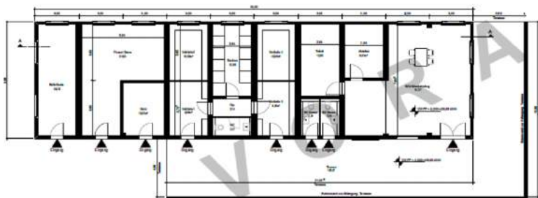
Grundriss Erdgeschoss, M 1:100