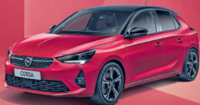
Beispielfoto der Baureihe. Ausstattungsmerkmale ggf. nicht Bestandteil des Angebots.