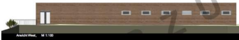
Anzicht West, M 1:100