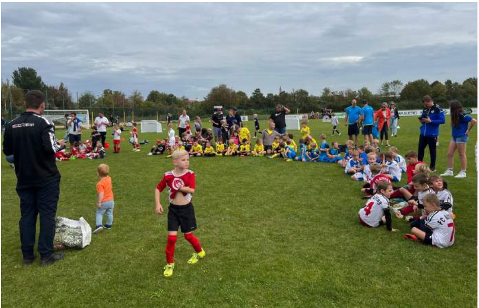
Große Freude herrschte bei unseren Kleinsten beim Funino-Turnier beim TSV Friedberg