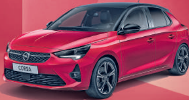
Beispielfoto der Baureihe. Ausstattungsmerkmale ggf. nicht Bestandteil des Angebots.