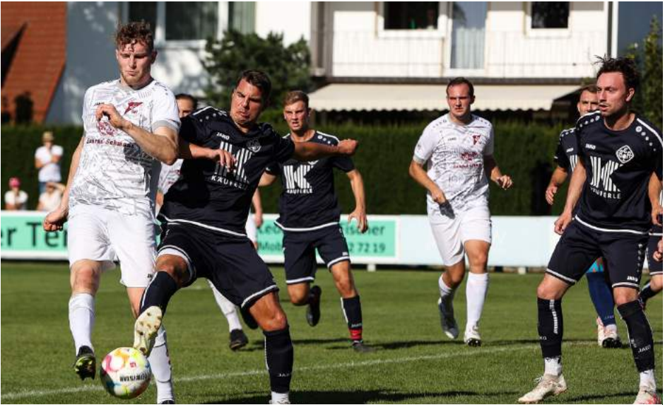
Strafraumszene beim Spiel gegen BC Adelzhausen