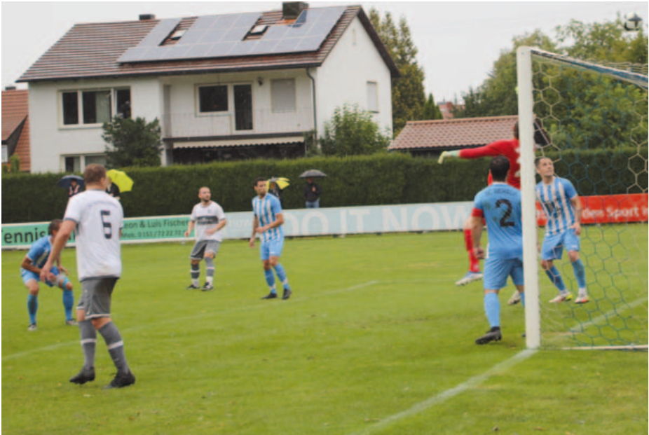
Torraumszene im Spiel gegen den SV Hammerschmiede.