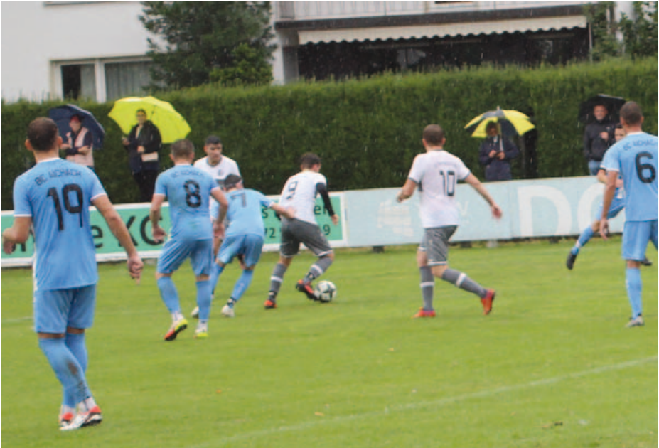
Einsatz im Spiel gegen den SV Hammerschmiede.