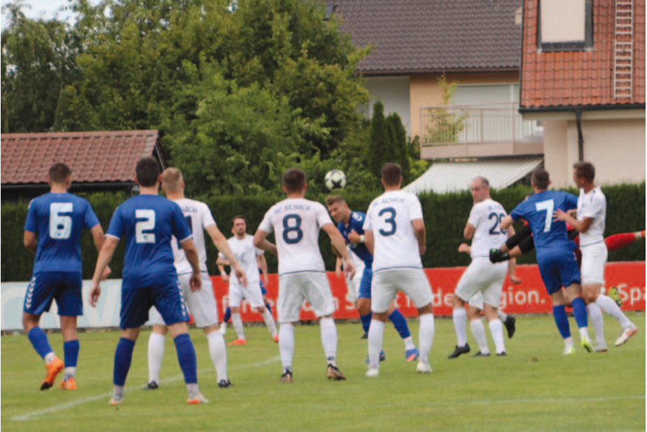
Torraumszene im Spiel gegen SSV Alsmoos-Petersdorf.