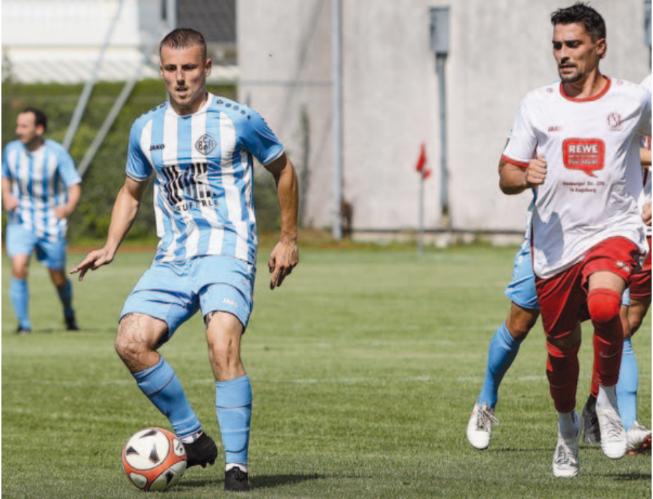
Mittelfeldstrategie Fuchsi beim Spielaufbau gegen den TSV Firnhaberau.