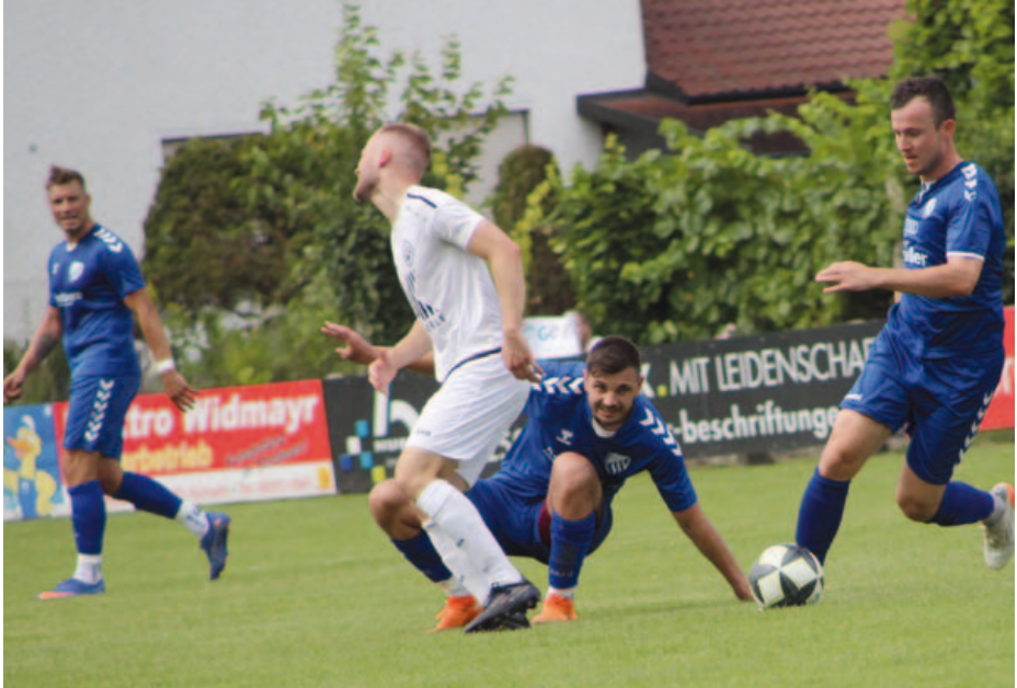
Einsatz im Spiel gegen SSC Alsmoos-Petersdorf.