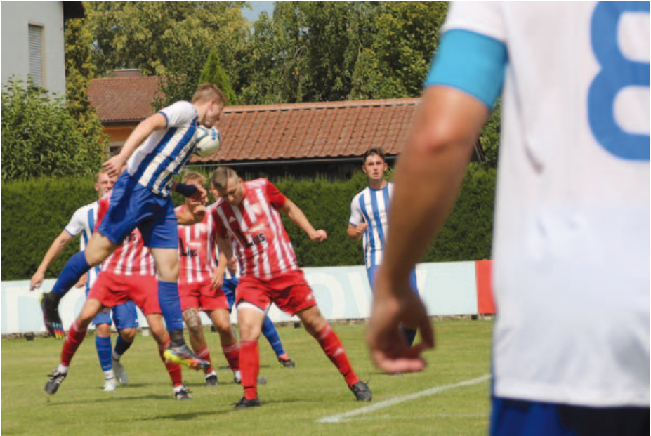
Torraumszene im Spiel der 2. Mannschaft gegen Echsheim.