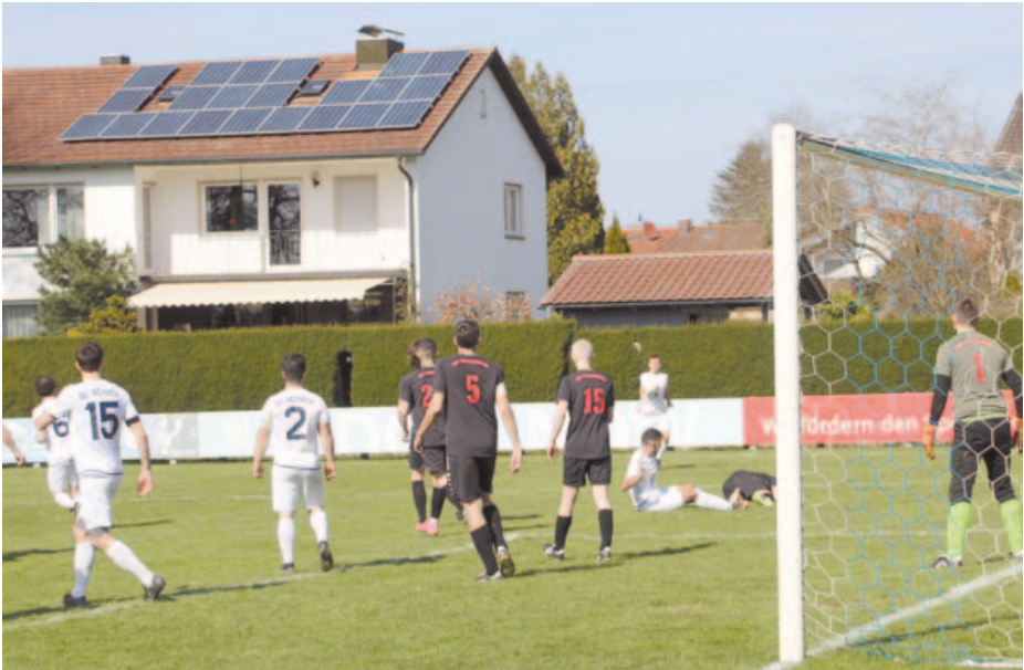
Noch ein Bild aus dem Spiel gegen den TSV Firnhaberau.