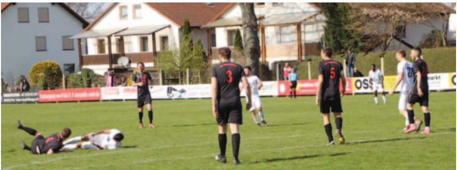
Bilder aus dem Spiel gegen den TSV Firnhaberau.