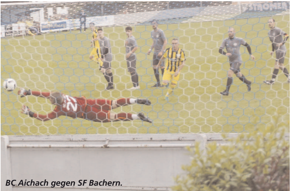
BC Aichach gegen SF Bachern.