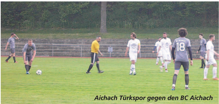
Aichach Türkspor gegen den BC Aichach

Text: Klaus Ratzeck