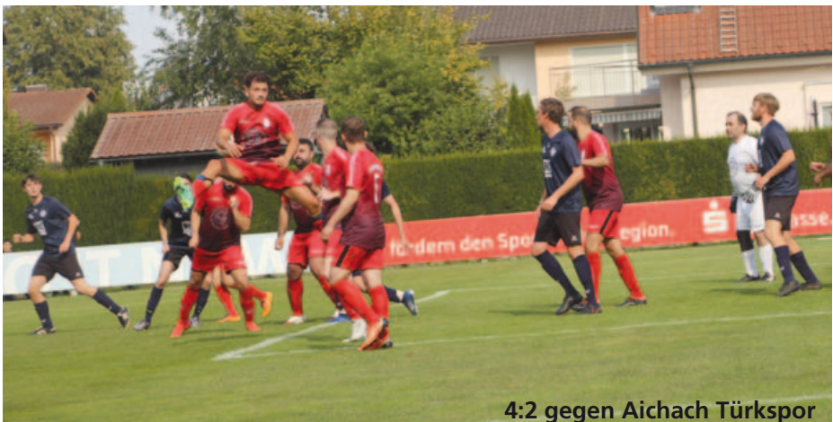
4:2 gegen Aichach Türkspor