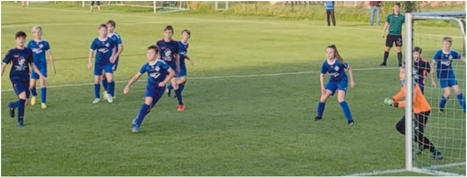
Das 0:1 für den Gast aus dem Neuburger Umland nach einer Ecke.