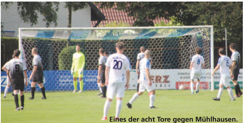
Eines der acht Tore gegen Mühlhausen.