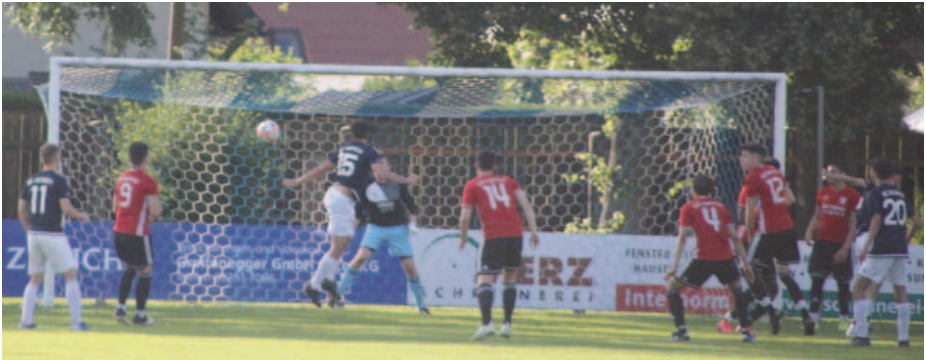
Das Tor gegen DJK Ingolstadt zum Endergebnis von 3:0.